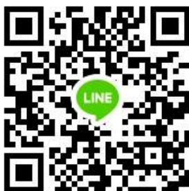
Line Group พรก.ทส. ๒๕๖๗